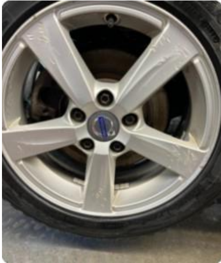
1.1 Riper i vinterfelger.