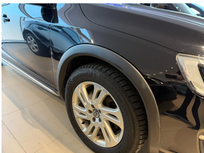
1.2 Riper hjulbuelist høyre foran.