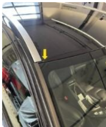
1.5 Korodert steinsprang framkant tak.