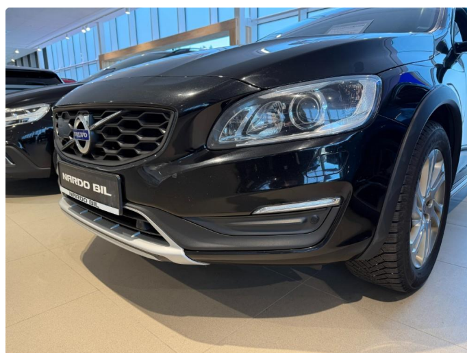
1.3 Steinsprut, små riper støtfanger foran.