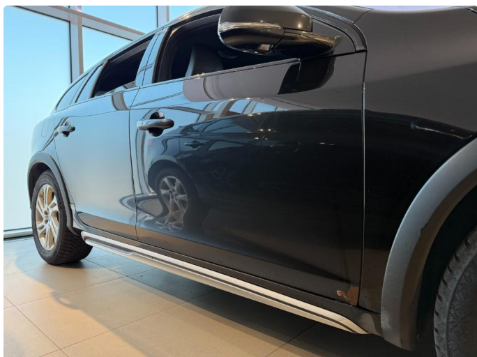
1.1 Korosjon framkant begge framdører.