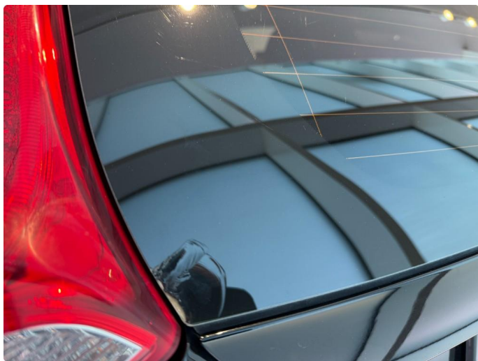
1.6 Skade bakrute.