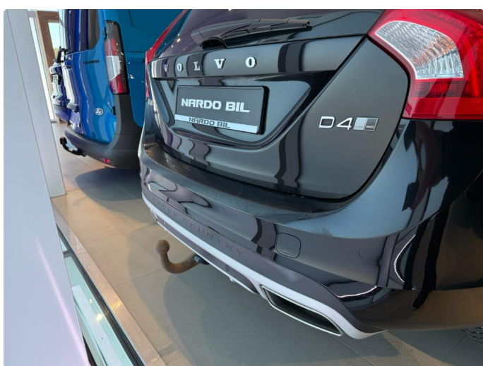
1.4 Bruksmerker/riper bakluke og støtfanger bak.