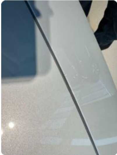
1.1 Noen små steinsprut støtfanger foran.