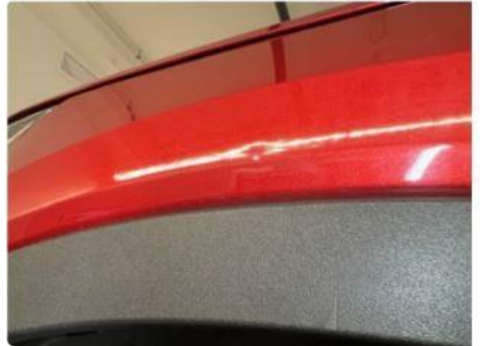
1.2 Liten bulk venstre foran