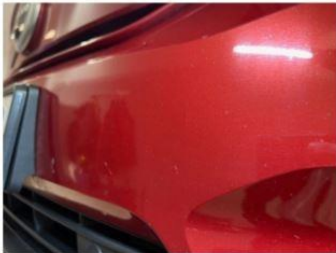
1.3 Noen steinsprang foran