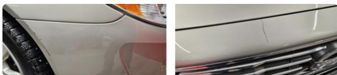
1.5 Riper støtfanger foran.