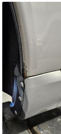
1.2 Lakk flasser