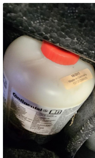
1.4 Dekktettemiddel utgått