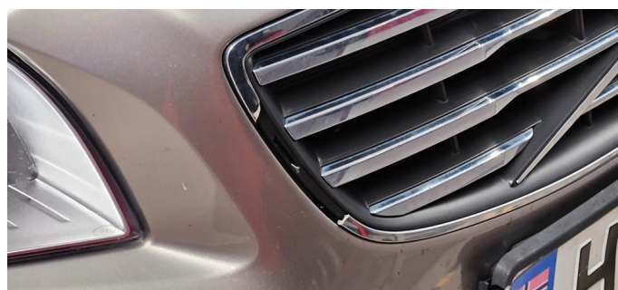
1.6 Skadet grill.