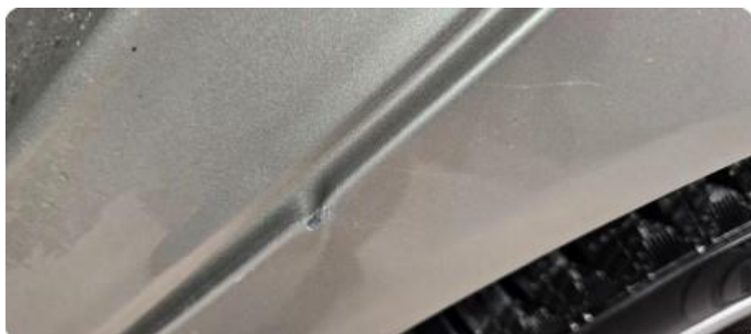
1.3 Bulk baksjerm venstre.