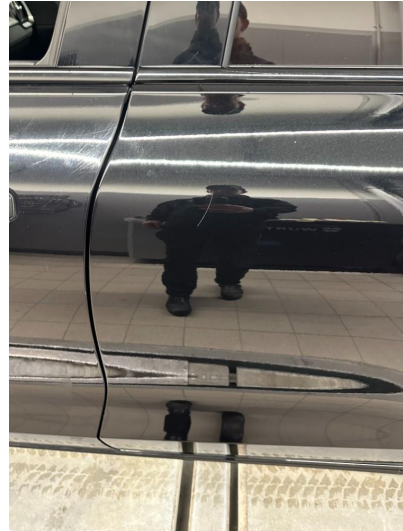
1.1 Små riper bakdør venstre.