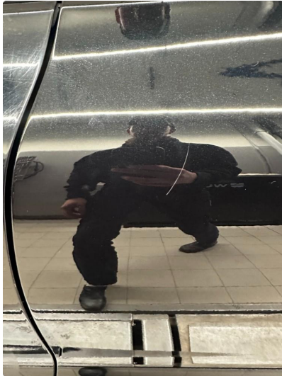
1.1 Små riper bakdør venstre.