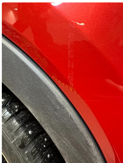
1.2 Minibulk dør/hjulbue høyre bak.