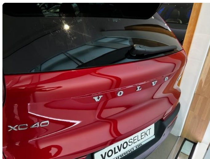
1.3 Minibulk bakluke