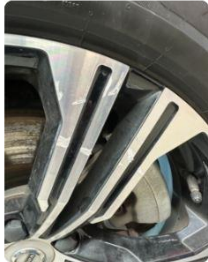
1.2 Riper i sommerfelger.