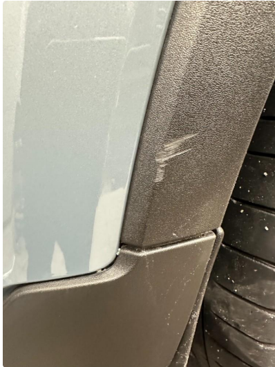
1.1 Ripe skjermutbygger venstre foran