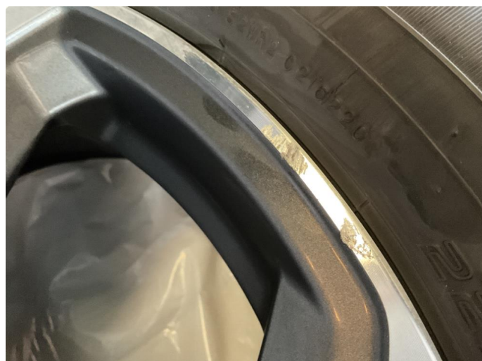
1.3 Kantkjørt felg Diamond Cut