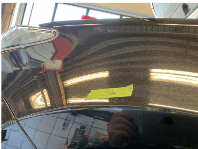
1.2 Liten bulk v forskjerm