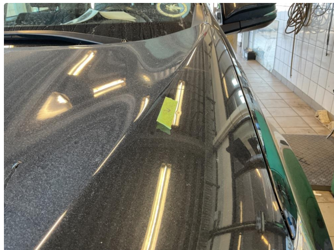
1.1 Liten bulk panser v side