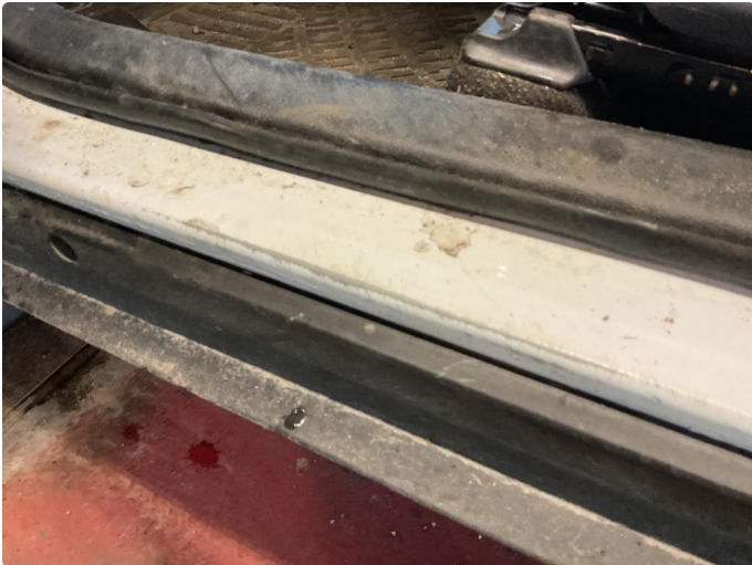
1.1 Slitt innsteg