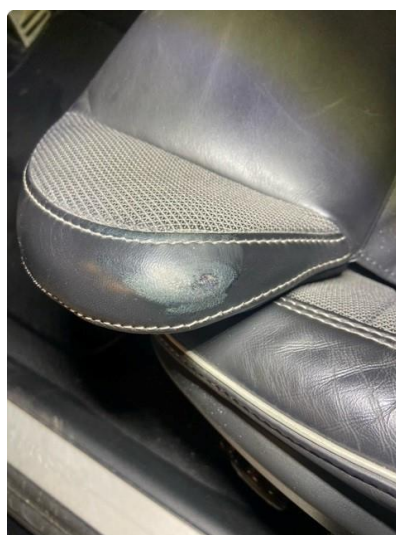
2.1 Liten slitasjeskade på lårstøtte førersete.