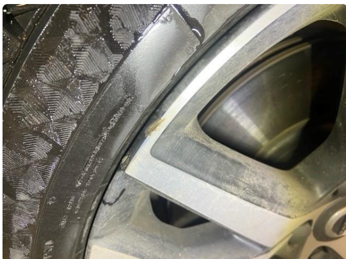
1.1 Liten kantkjøring på 2 vinterfelger.