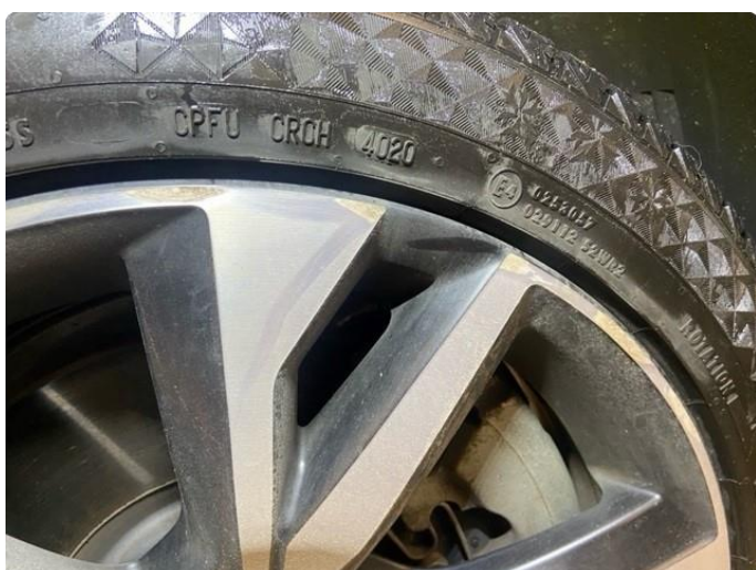
1.1 Liten kantkjøring på 2 vinterfelger.