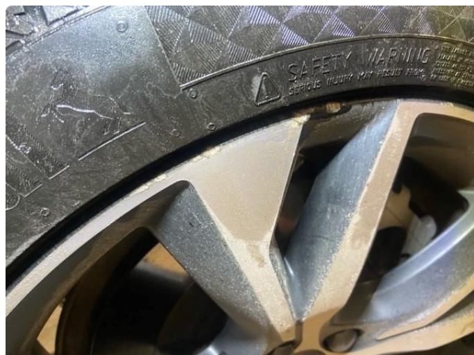
1.1 Liten kantkjøring på 2 vinterfelger.