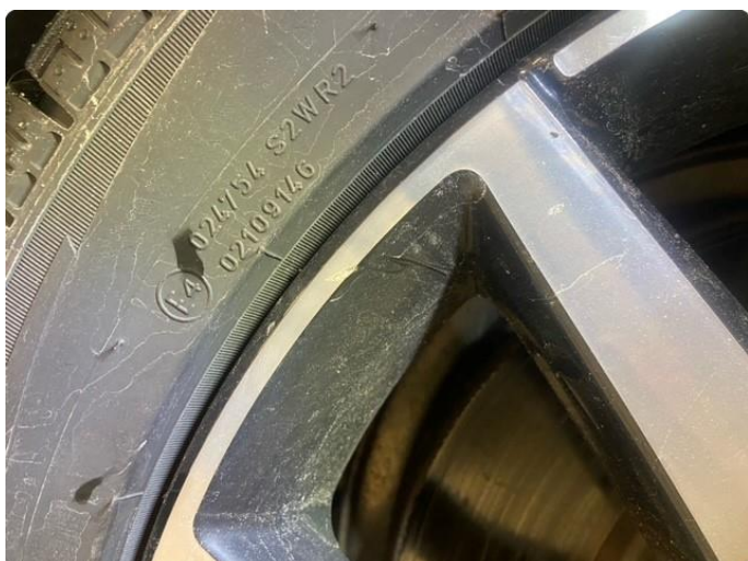
1.1 Lite merke i felg