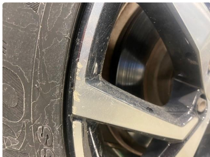
1.1 Lite merke i felg