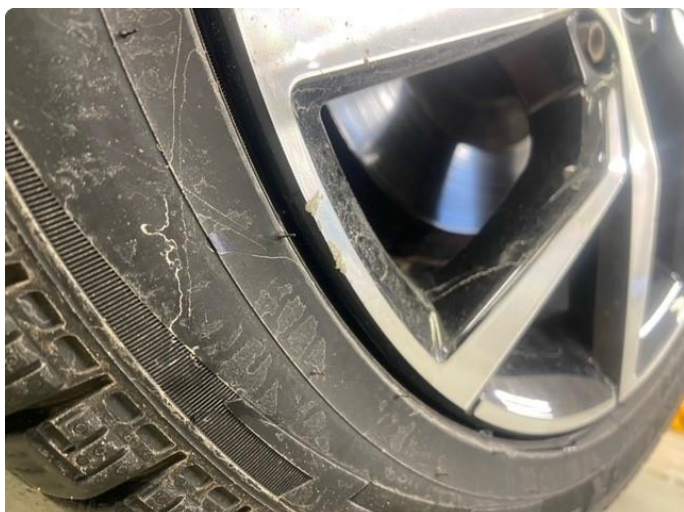
1.1 Lite merke i felg