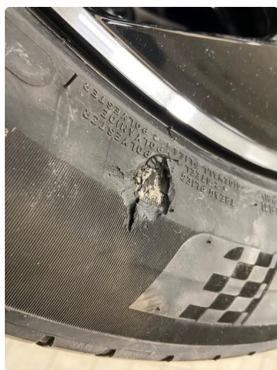
1.2 Liten kosmetisk skade på 1 sommerfelg. Montert 2 nye sommerdekk pga skade i dekkside.