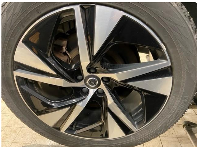
1.1 Liten kosmetisk skade på 1 vinterfelg.