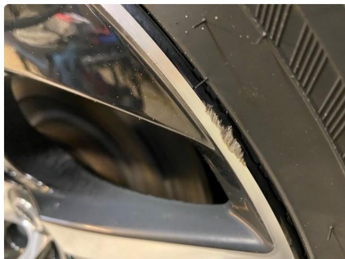
1.1 Liten kosmetisk skade på 1 vinterfelg.