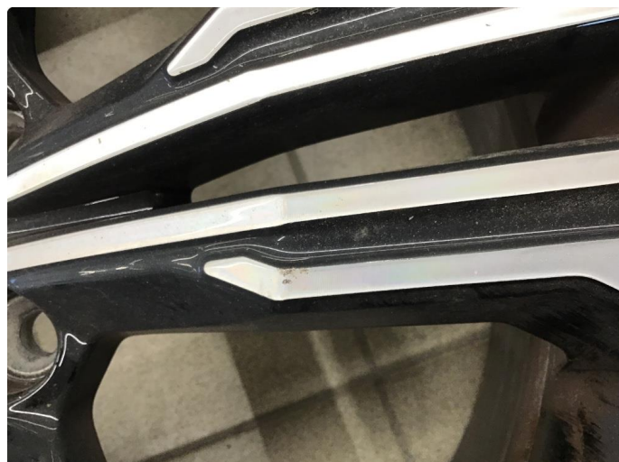
1.1 Skade på felg