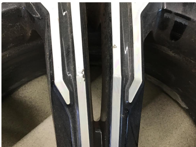
1.1 Skade på felg