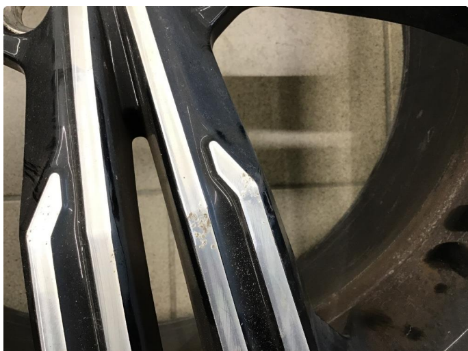
1.1 Skade på felg