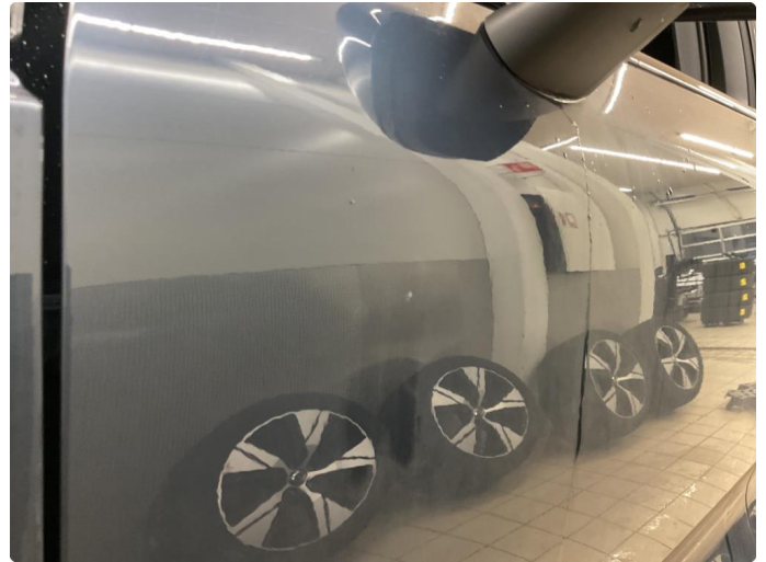
1.2 Bulk med lakkskade