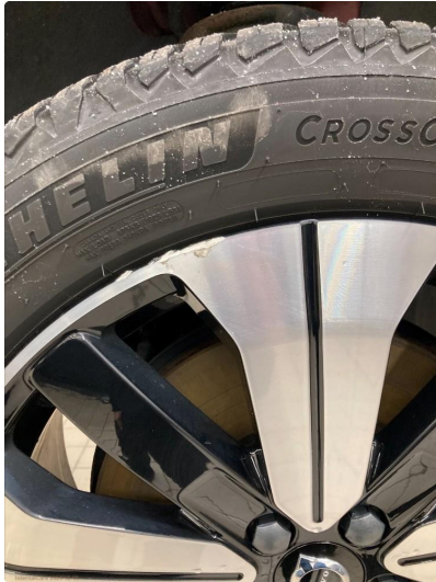
1.2 Skade på felg