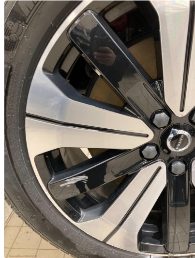
1.2 Skade på felg