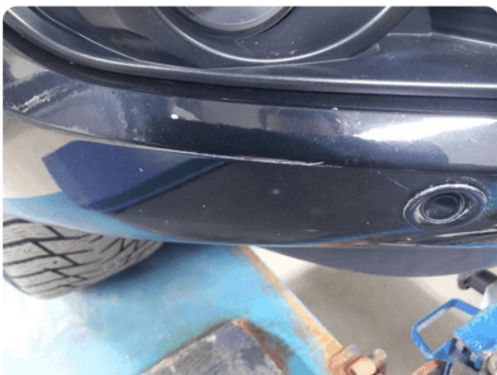
1.11 Ripe(r) ned til grunning