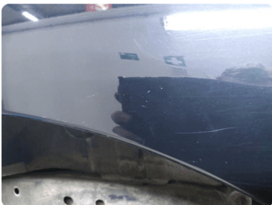
1.5 Ripe(r) ned til grunning