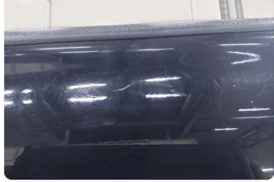
1.3 Ripe(r) ned til grunning