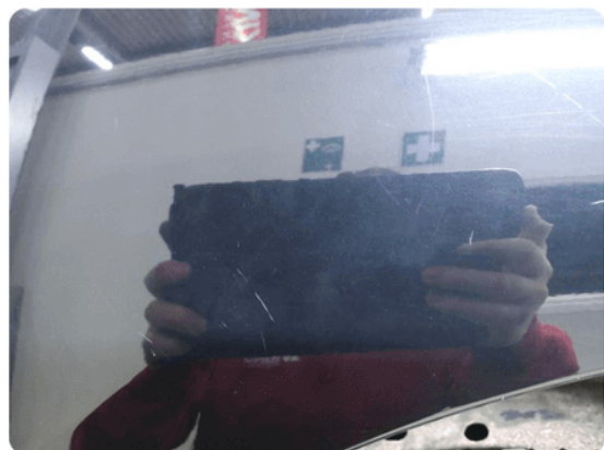
1.5 Ripe(r) ned til grunning