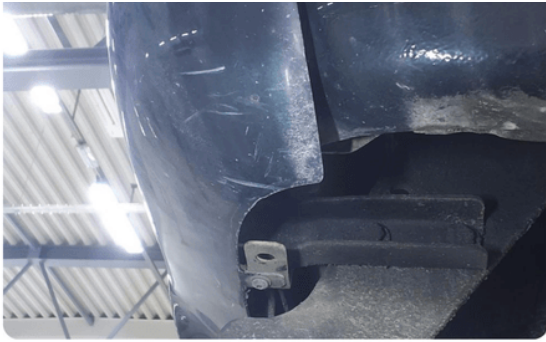
1.10 Ripe(r) ned til grunning