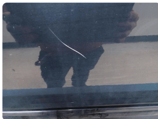
1.2 Ripe ned til grunning