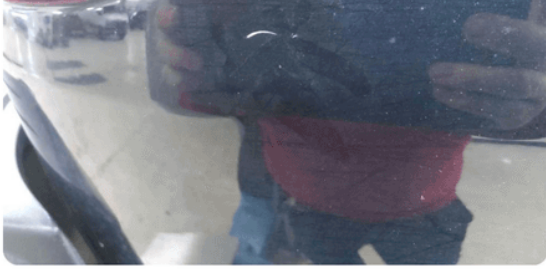
1.5 Ripe(r) ned til grunning