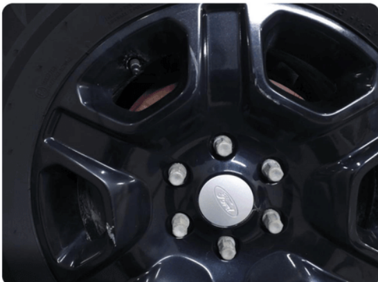
1.9 Kantkjørt felg Vinter felg