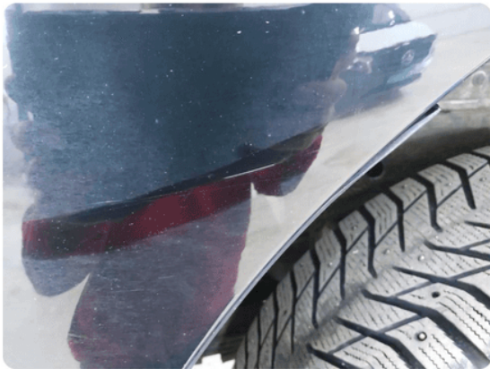
1.4 Ripe(r) ned til grunning