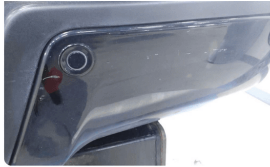
1.10 Ripe(r) ned til grunning