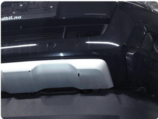
1.11 Ripe(r) ned til grunning