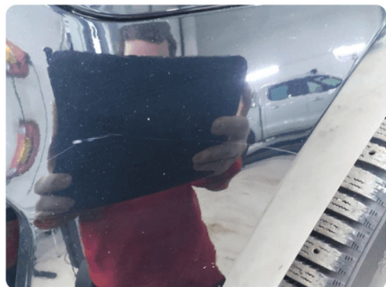
1.11 Ripe(r) ned til grunning