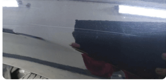
1.6 Ripe(r) ned til grunning