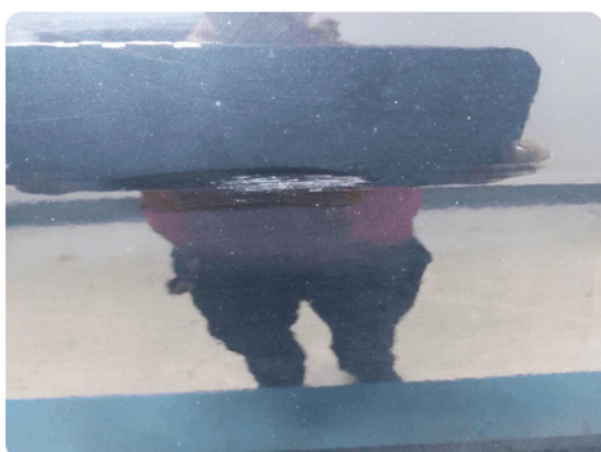
1.2 Ripe ned til grunning