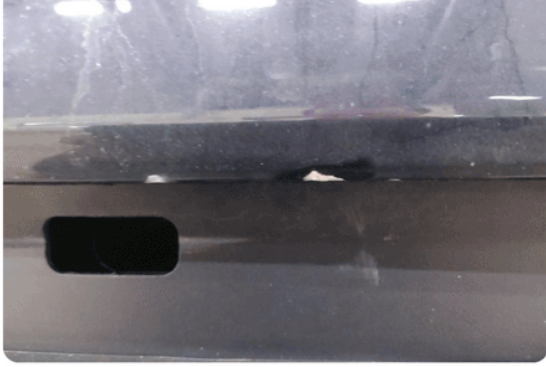
1.3 Ripe(r) ned til grunning