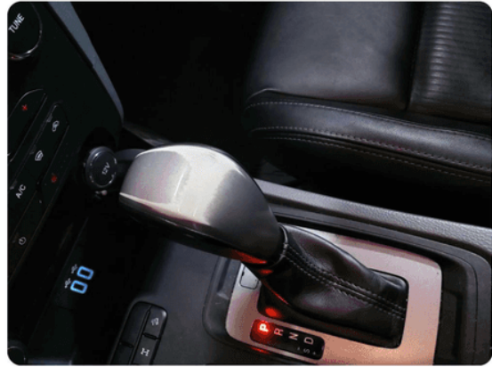
2.1 Øvrige feil Girkule slitt