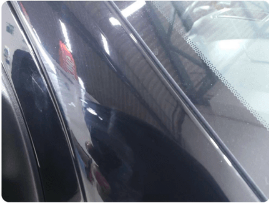
1.12 Ripe ned til grunning