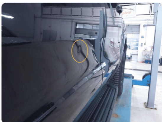
1.1 Bulk med lakkskade