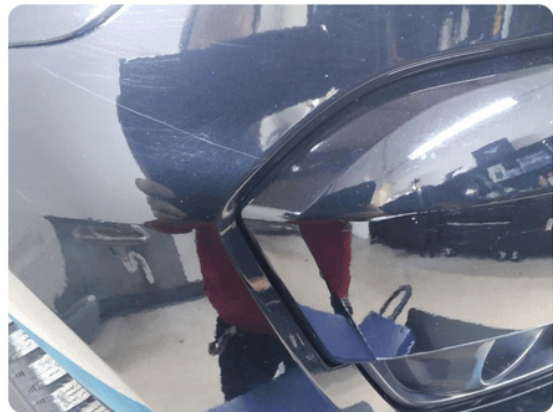
1.11 Ripe(r) ned til grunning