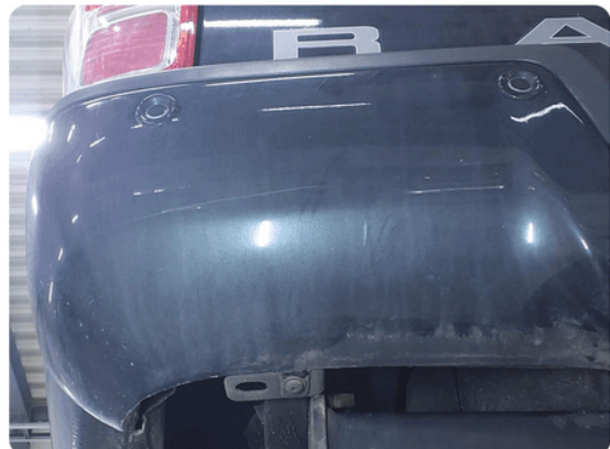
1.10 Ripe(r) ned til grunning