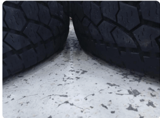
1.8 Skjev slitasje på sommerdekk