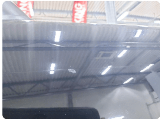
1.4 Ripe(r) ned til grunning