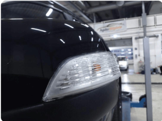
1.7 Blinklys defekt/fukt