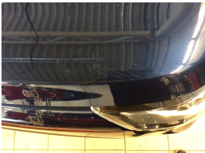
1.1 Riper. Spot repair