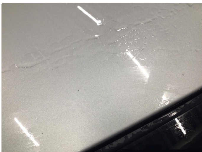
1.2 Steinsprut - blir penslet