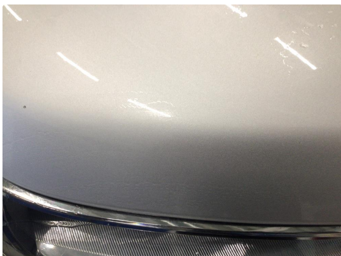
1.1 Smått med steinsprut