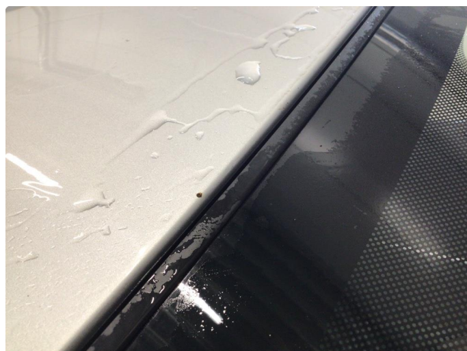
1.2 Steinsprut - blir penslet