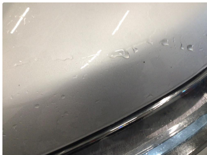
1.1 Smått med steinsprut