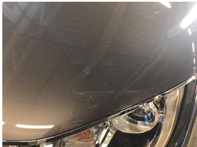
1.1 Noe steinsprut med rust