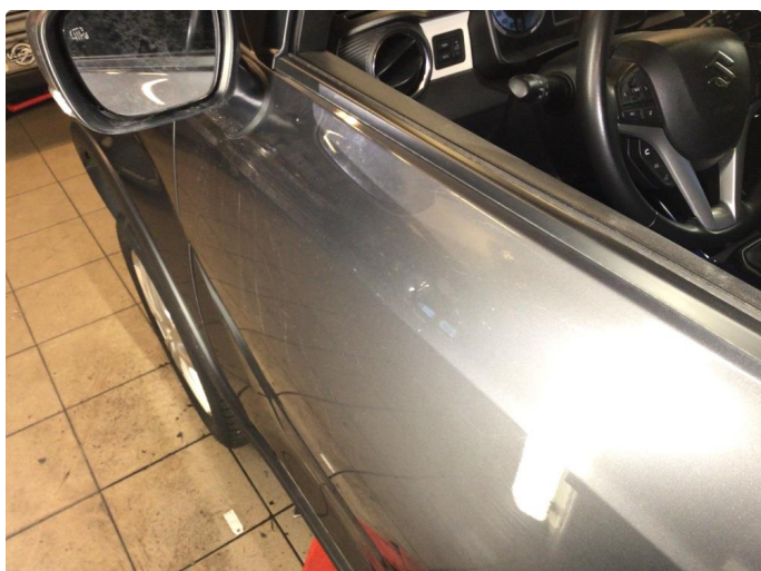
1.2 Bulk med lakkskade - pensles