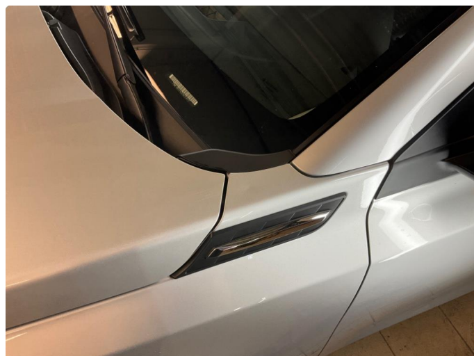
1.2 Bulk - blir fikset av karosseriverksted