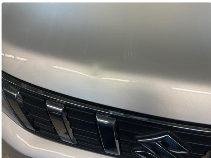
1.1 Bulk - blir fikset av karosseriverksted