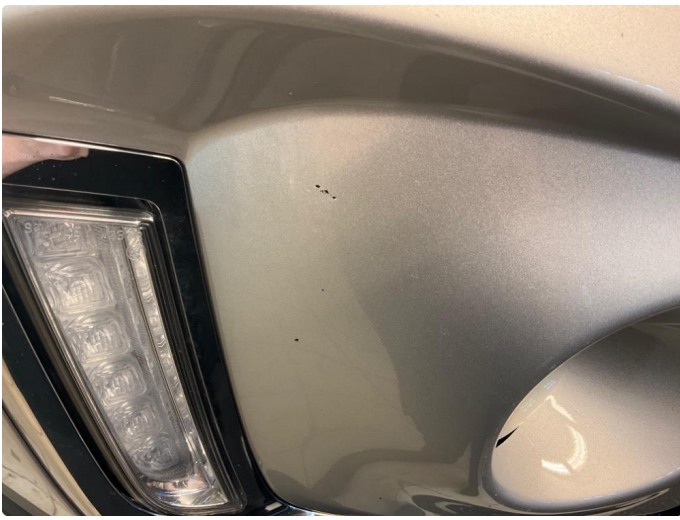
1.3 Sått med steinsprut på støtfanger