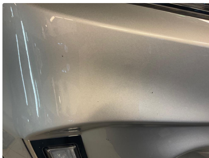
1.3 Sått med steinsprut på støtfanger