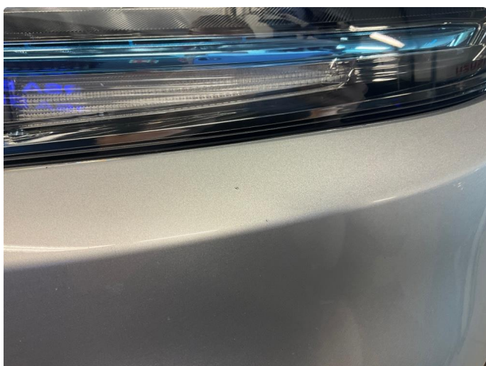
1.3 Sått med steinsprut på støtfanger