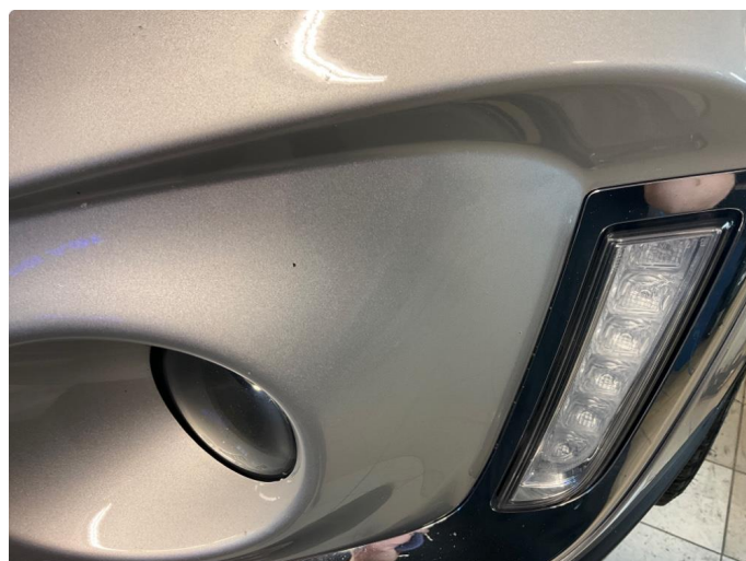
1.3 Sått med steinsprut på støtfanger