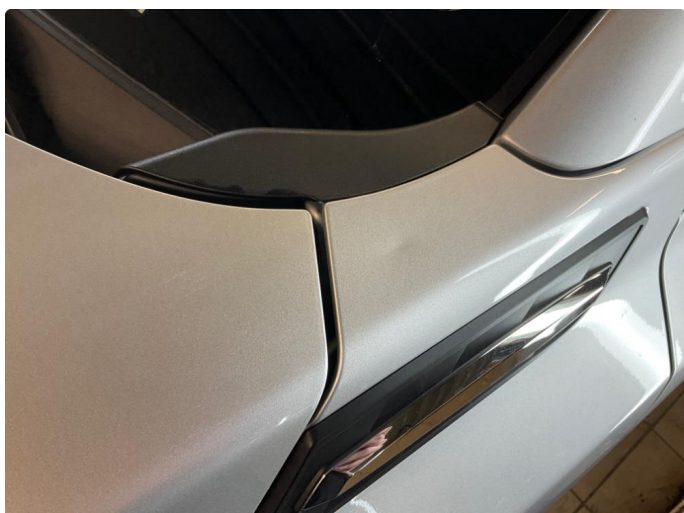
1.2 Bulk - blir fikset av karosseriverksted