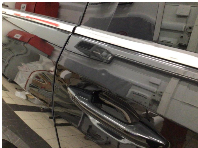
1.2 Bulk - blir fikset av karosseriverksted