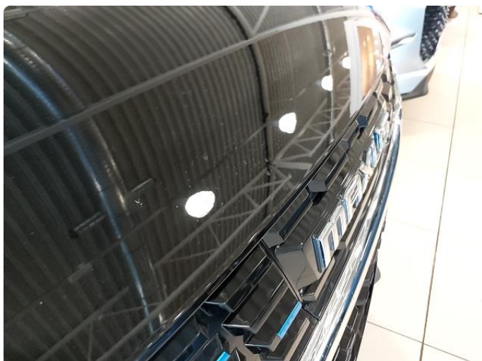
1.1 Panser har noe steinsprut