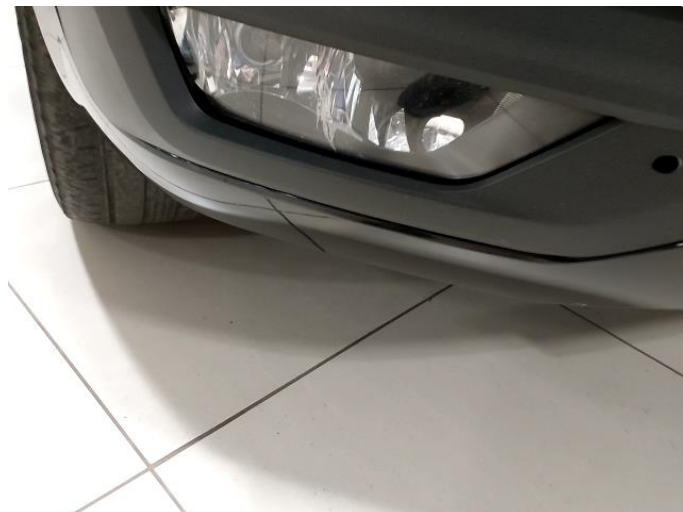
2.1 Skrap på tåkelykt