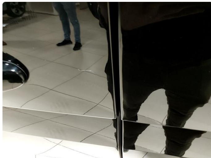
1.2 Skrap på skyvedør