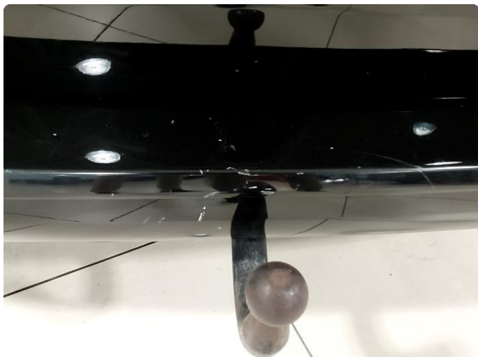
1.3 Skrap på fanger