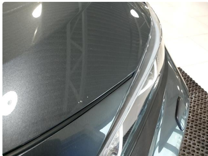
1.1 Noen små steinsprut panser