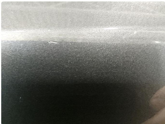
1.2 Liten ripe venstre bakdør