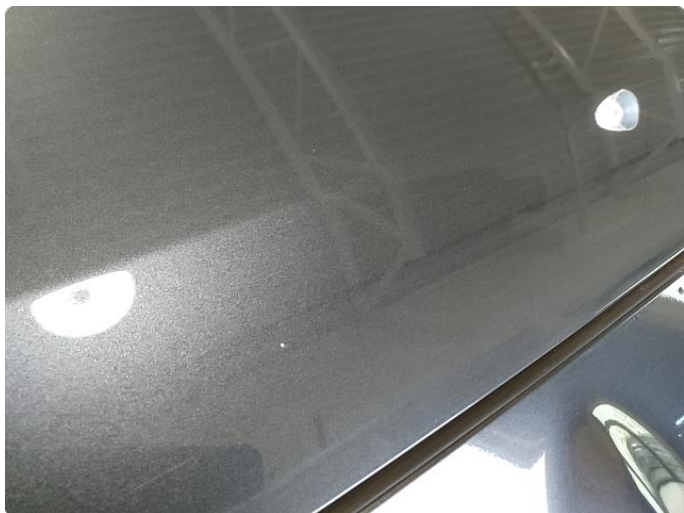
1.1 Noen små steinsprut panser