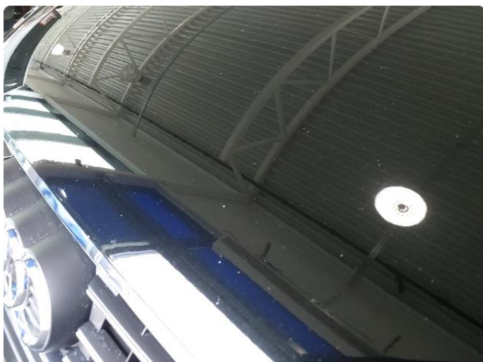
1.1 Normal slitasje med steinsprut panser