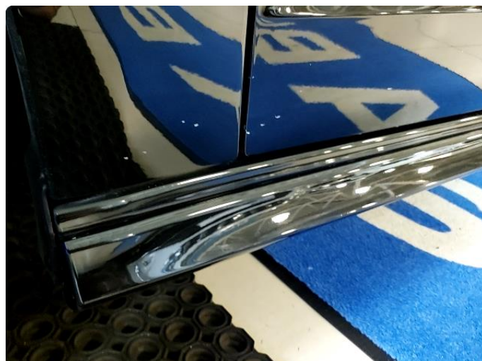
1.2 Små steinsprut ned til grunning - flekkes før levering