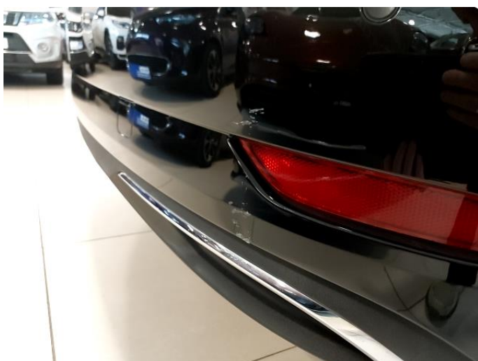
1.5 Småskraper begge sider