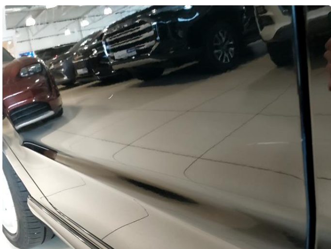
1.3 2 små riper til grunning