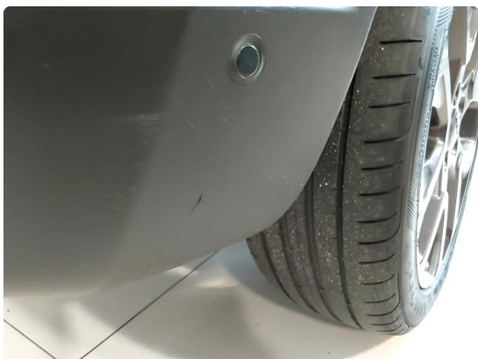
1.3 Liten skrape i plastfanger