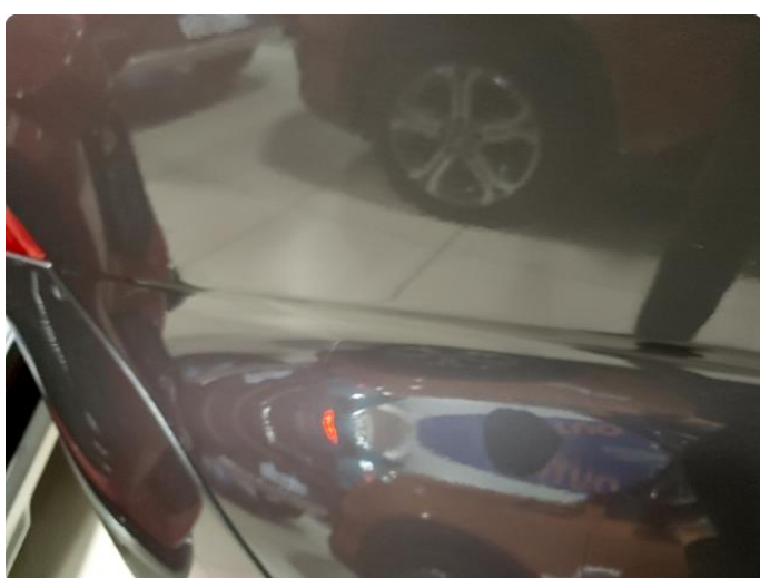
1.5 Liten skrap