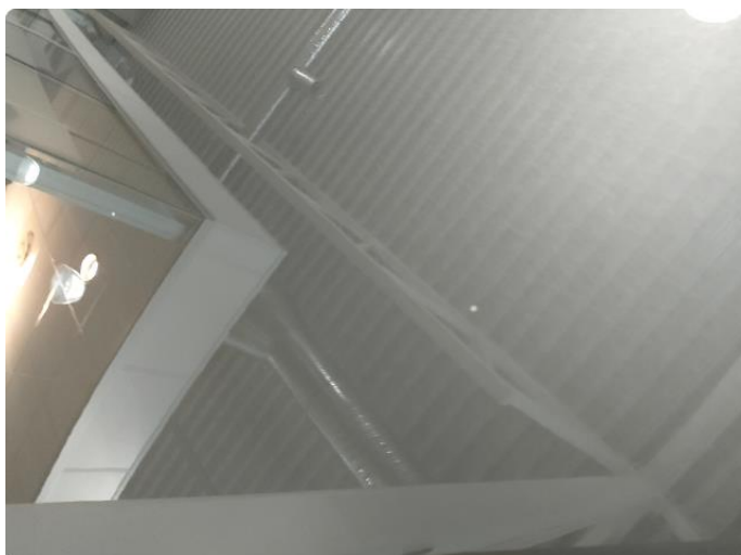
1.1 Smått med steinsprut - normal slitasje