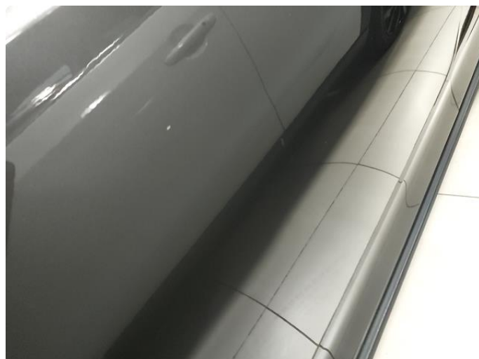
1.2 Liten steinsprut