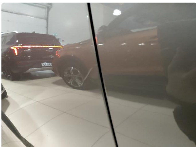
1.3 Liten ripe