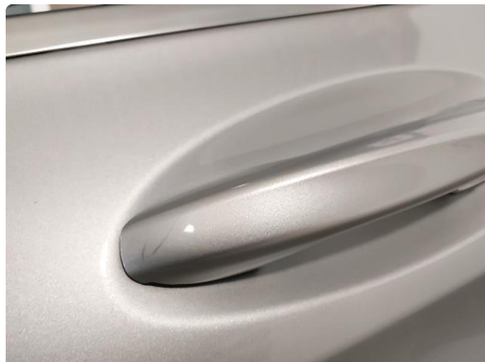
1.2 Småriper på dørhåndtak - normal slitasje