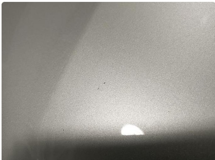
1.1 Så vidt noe steinsprut