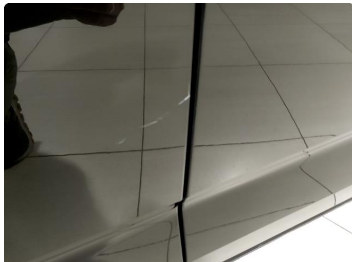
1.1 Små skrap