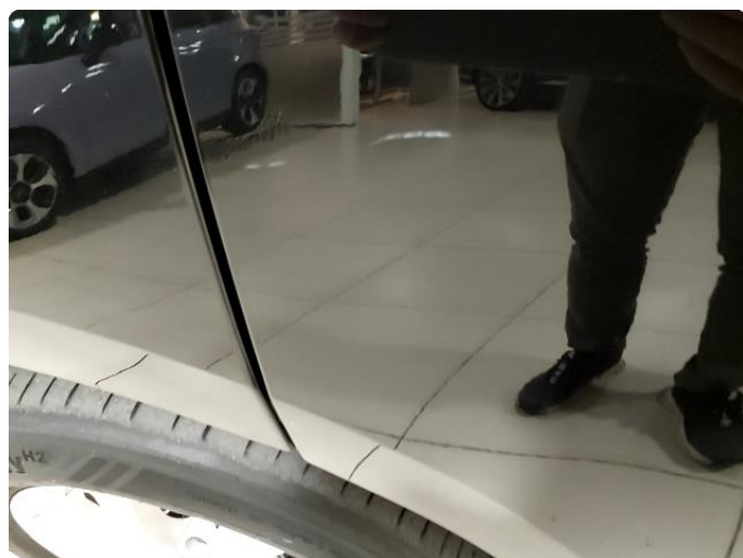
1.3 Små skrap