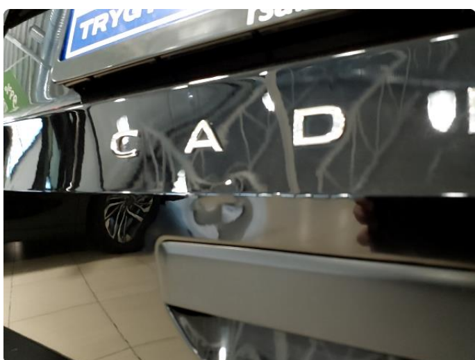
1.4 Liten bulk uten lakkskade