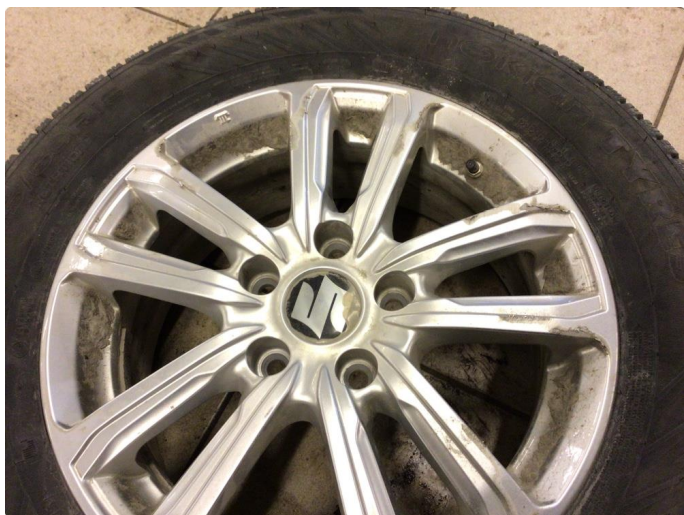
1.3 Kantkjørt felg