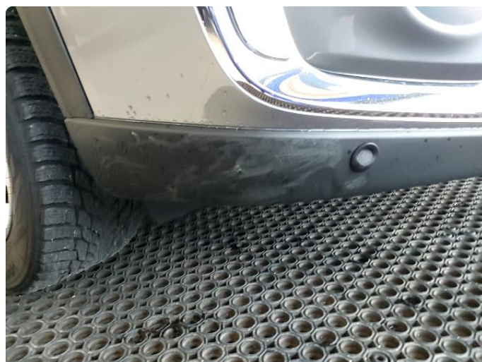
1.3 Noen riper på plast under fanger front