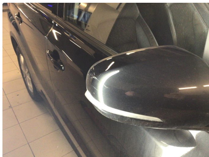
1.4 Speilhus riper