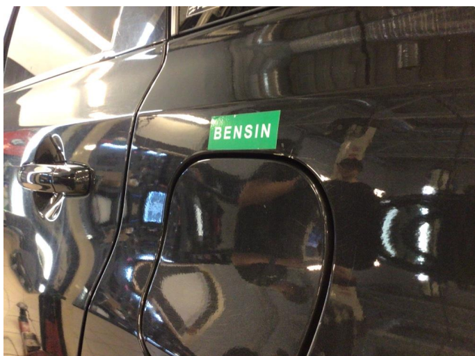
1.3 Ripe(r) - pensles med lakkstift