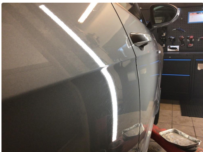
1.2 Lakkskade - pensles