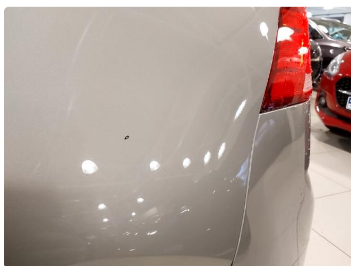
1.4 Steinsprut - pensles