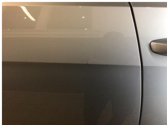
1.2 Lakkskade - pensles