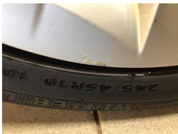
2.2 Kantkjørt felg