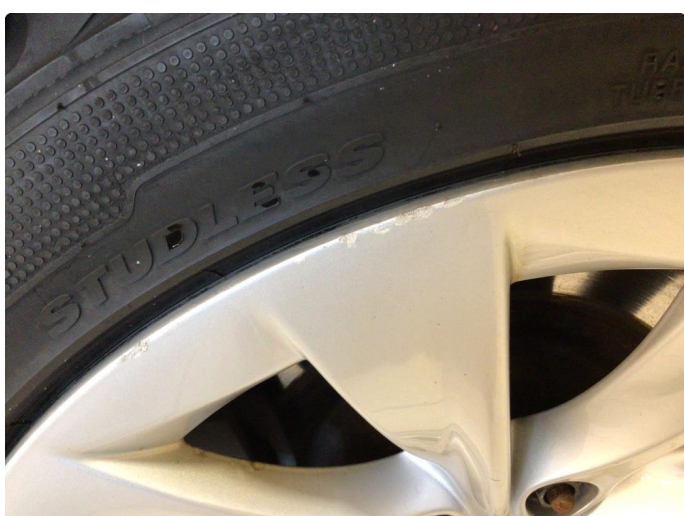
2.2 Kantkjørt felg