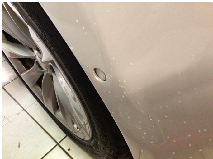
1.1 Funksjonsfeil på avstandsmåler