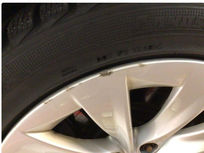
2.2 Kantkjørt felg