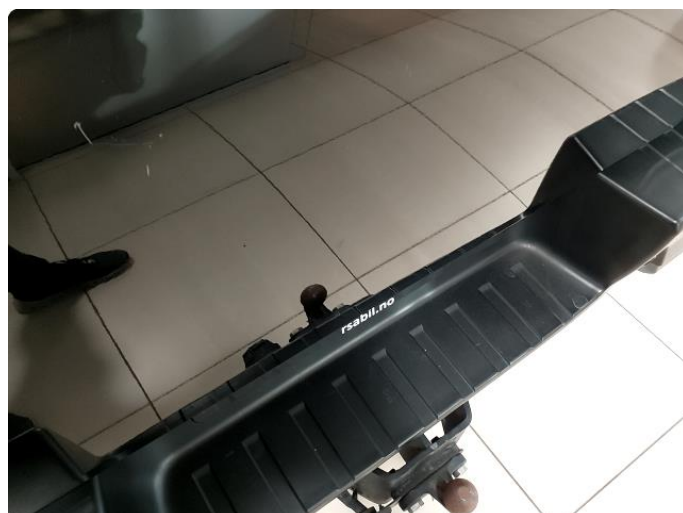
1.4 Små riper på lem- normal slitasje