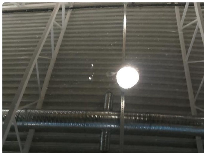
1.2 Steinsprut - normal slitasje