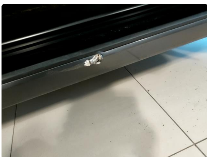
1.5 Hakk i stigtrinn