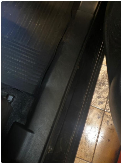
1.3 Slitt innsteg