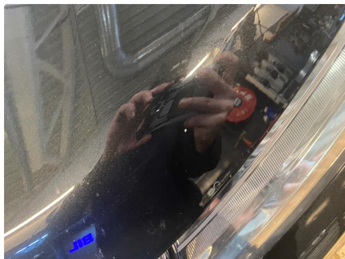
1.1 Noe steinsprut med rust