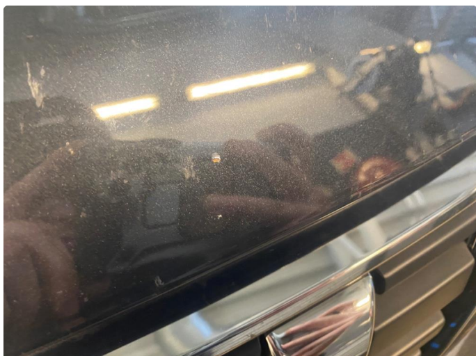
1.1 Noe steinsprut med rust