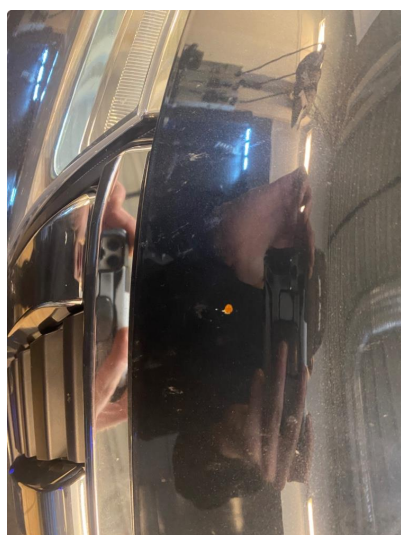
1.1 Noe steinsprut med rust