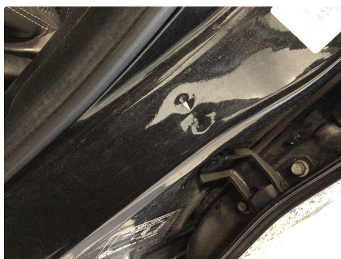
1.4 Bulk(er) med lakkskade