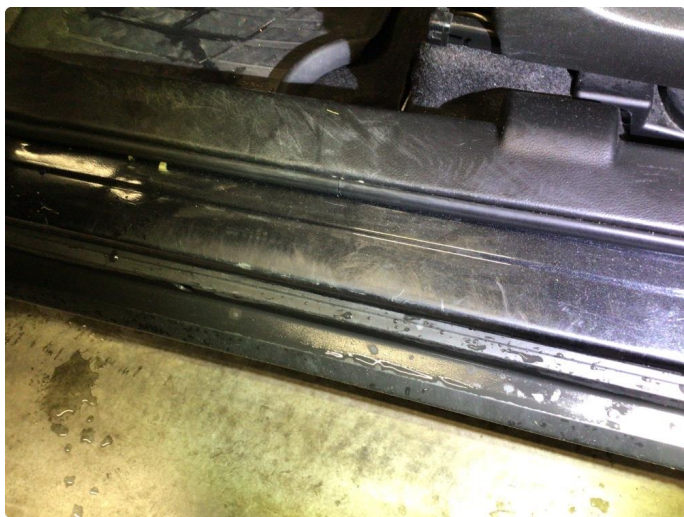
1.4 Bulk(er) med lakkskade