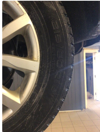
1.2 For liten mønsterdybde vinterdekk