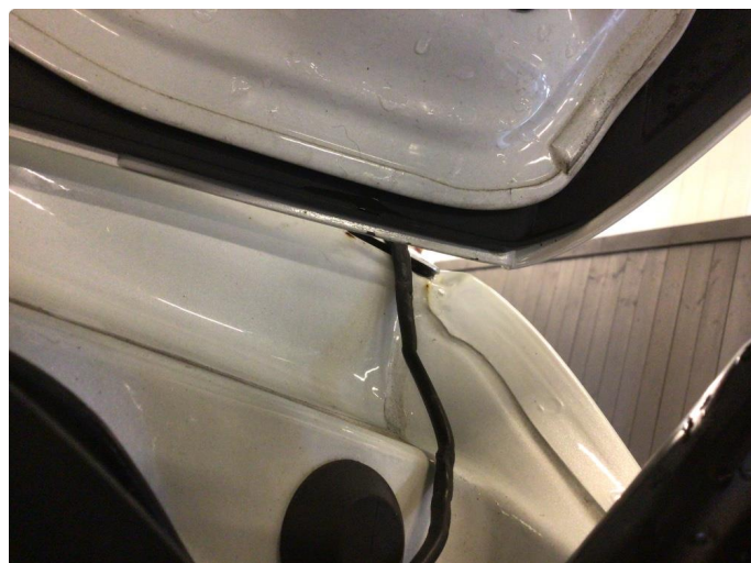
1.1 Løse/skadede lister