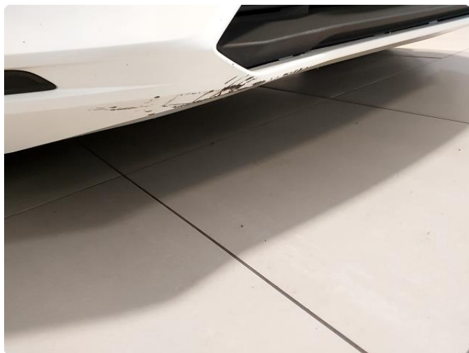
1.6 Skrap I støtfanger