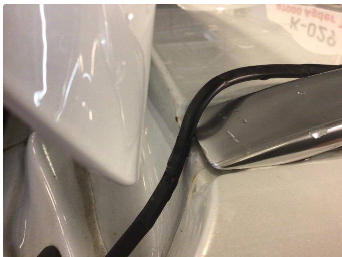
1.1 Løse/skadede lister