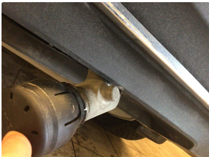
1.5 Øvrige feil