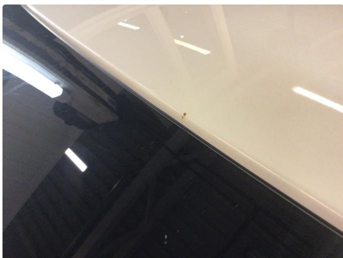
1.7 Steinsprut med rust