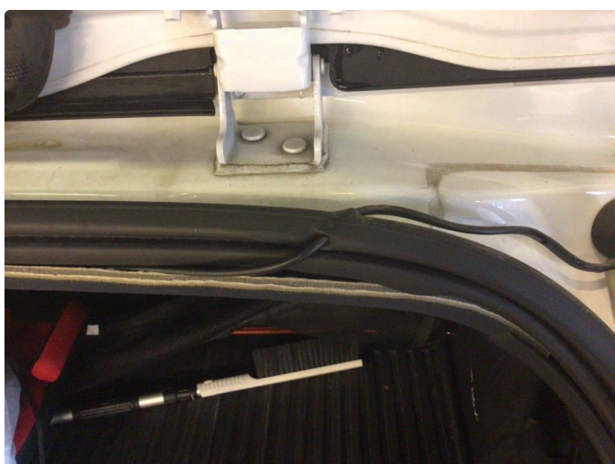
1.1 Løse/skadede lister