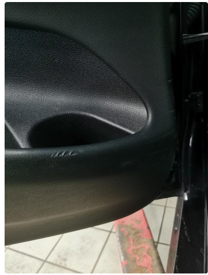
2.1 Noen småmerker