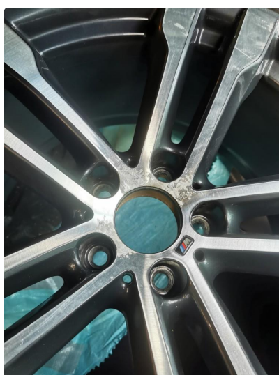
1.3 Noe oksidering vinterfelg