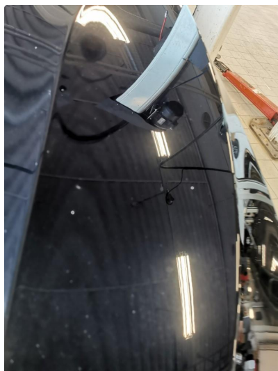
1.1 Noe stensprut som kan flekkes