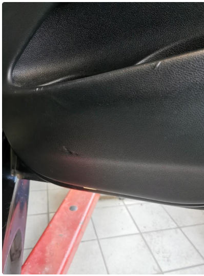
2.1 Noen småmerker