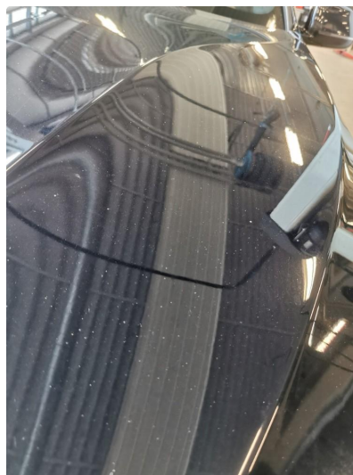
1.1 Noe stensprut som kan flekkes