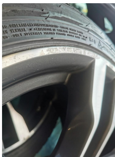
1.3 Noe oksidering vinterfelg