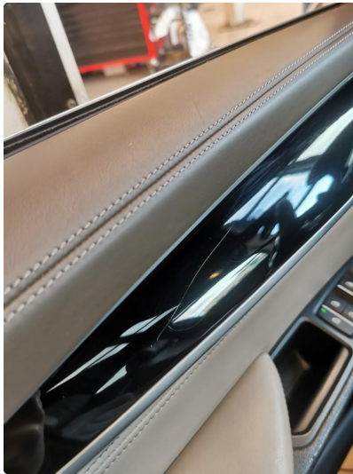
2.2 List liten skade