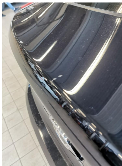
1.2 Liten ripe som flekkes