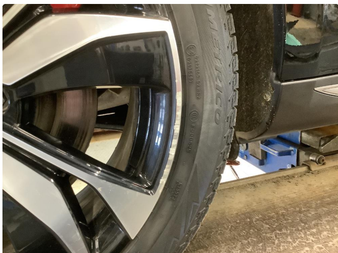
1.1 Noe bruksmerker på felg - normal iht alder / km