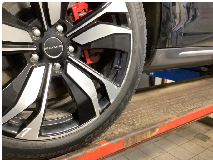
1.1 Noe bruksmerker på felg - normal iht alder / km