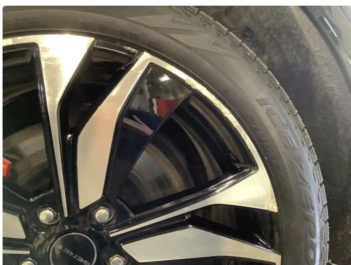
1.1 Noe bruksmerker på felg - normal iht alder / km