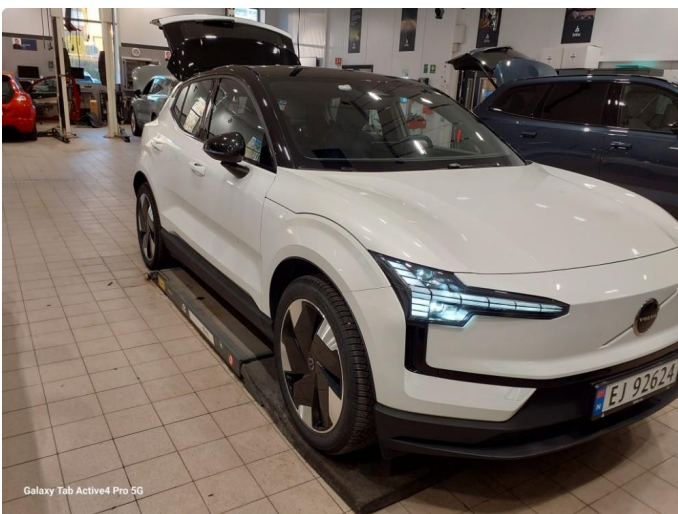
Galaxy Tab Active4 Pro 5G