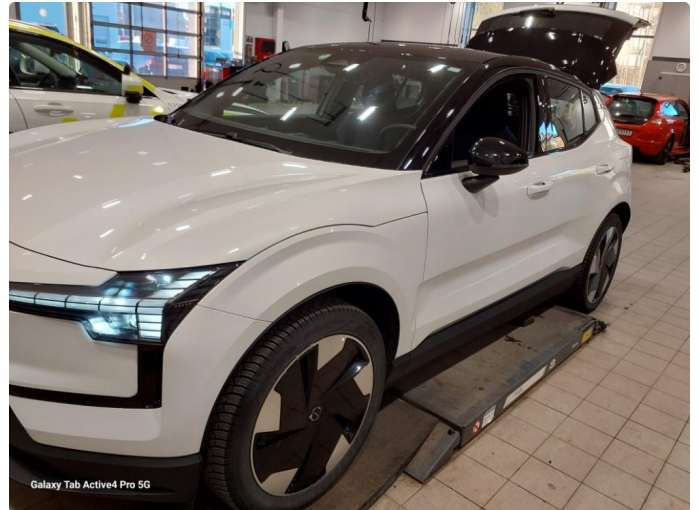
Galaxy Tab Active4 Pro 5G