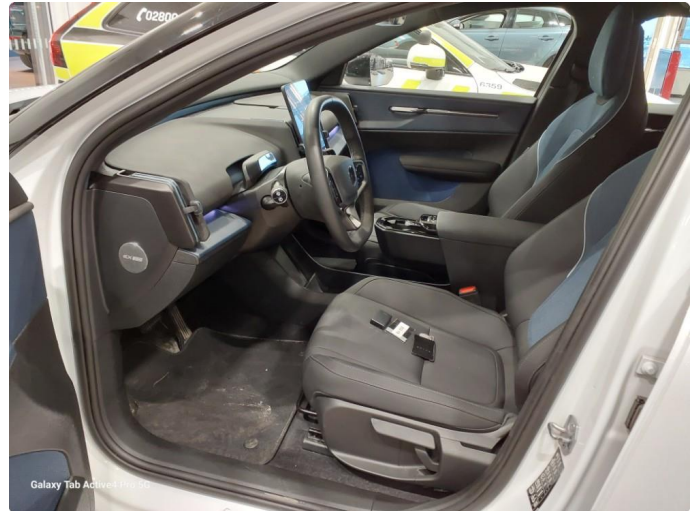
Galaxy Tab Active4 Pro 5G