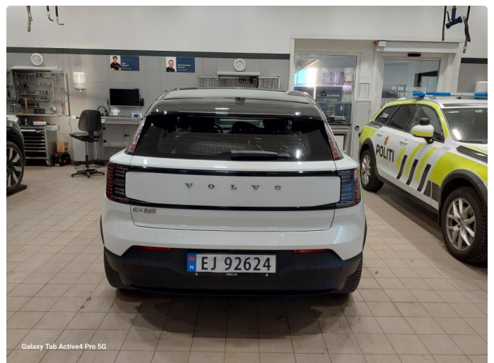
Galaxy Tab Active4 Pro 5G