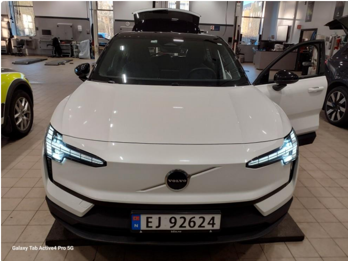
Galaxy Tab Active4 Pro 5G