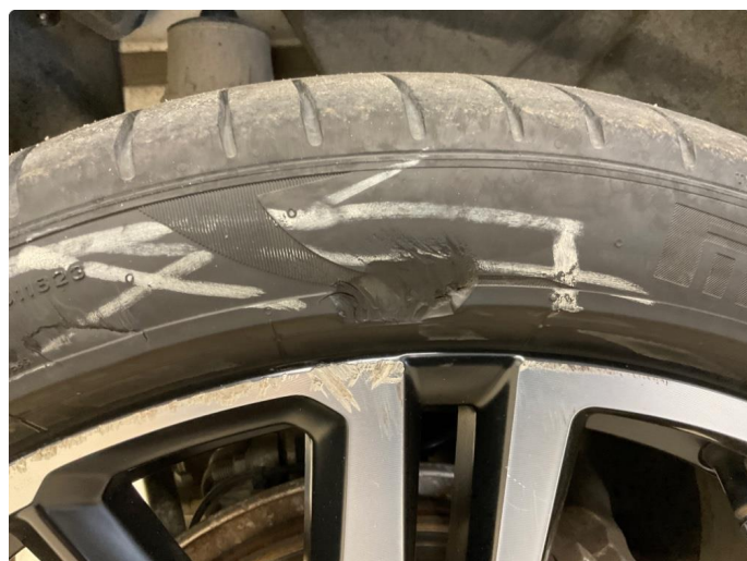
1.2 Dekkskade sommerhjul