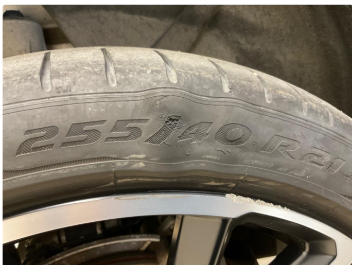
1.2 Dekkskade sommerhjul