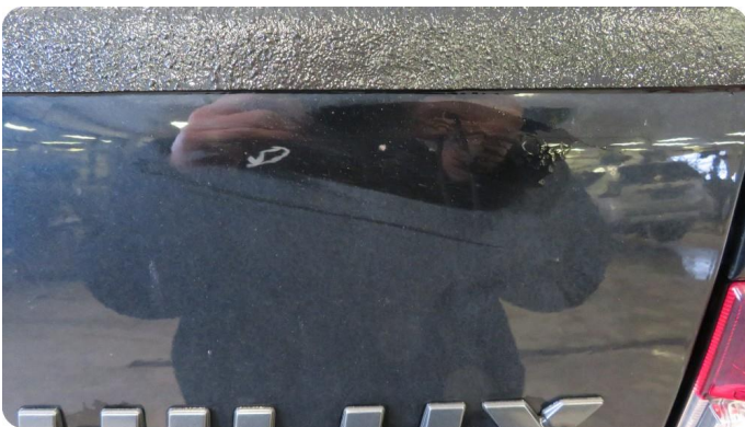
1.2 Steinsprut med rust