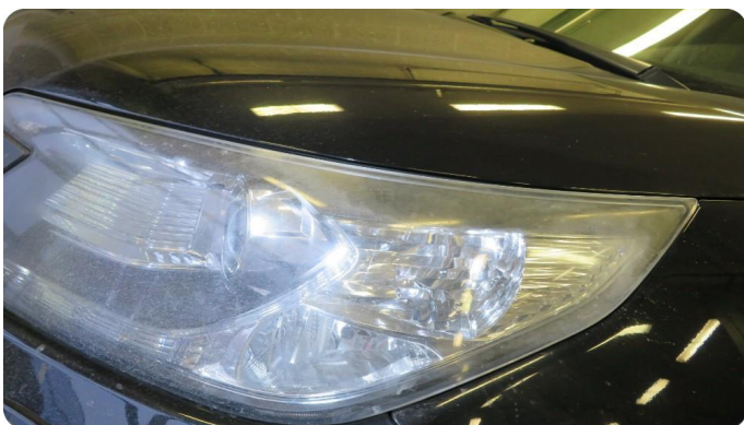
2.1 Matte glass Slitte/matte i toppen av lampa.