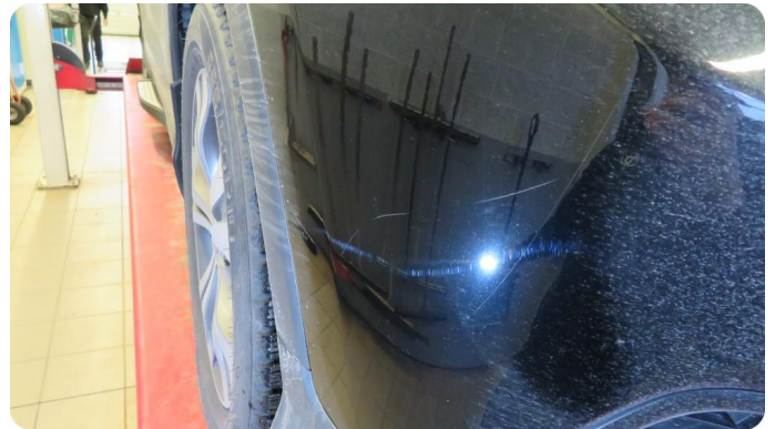
1.2 Ripe(r) Riper igjennom klarlakk.