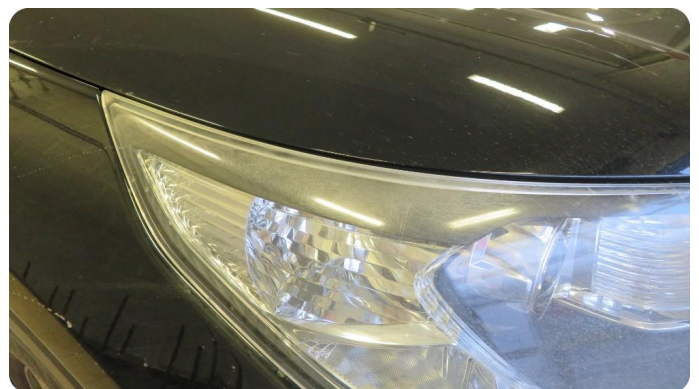
2.1 Matte glass Slitte/matte i toppen av lampa.