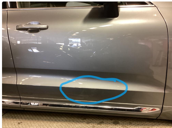
1.1 Ripe ned til grunning