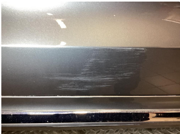
1.1 Ripe ned til grunning