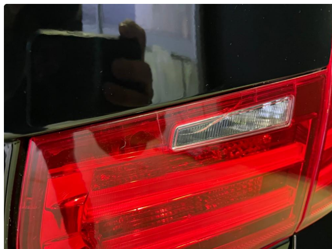
2.1 Begge indre baklamper krakelert