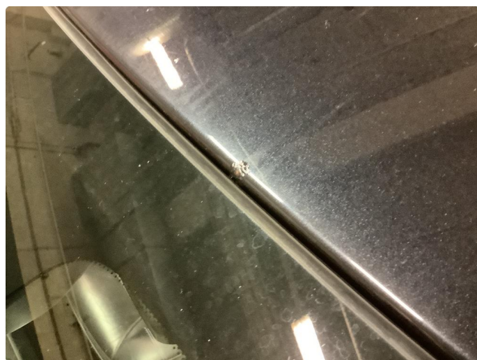
1.3 Liten rustblemme forkant tak