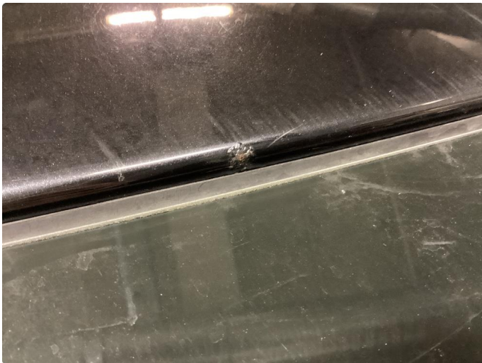
1.1 Steinsprut med rust