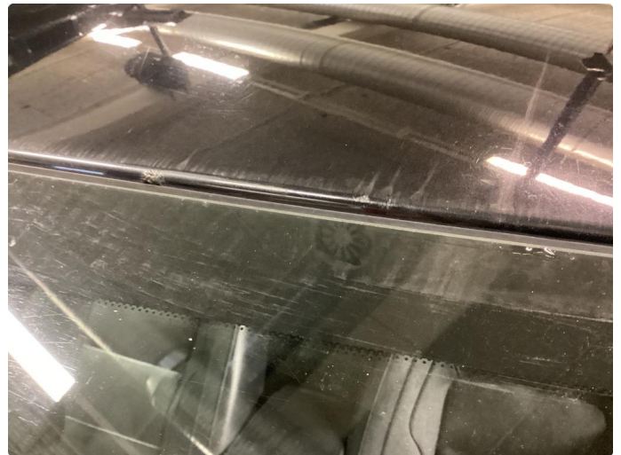
1.1 Steinsprut med rust